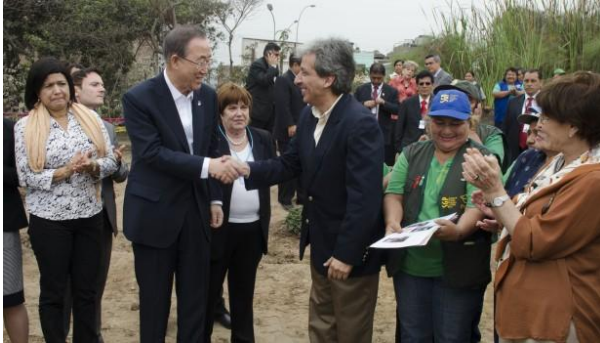
Ministro Manuel Pulgar - Vidal saluda a Secretario General de la ONU, Ban Ki - Moon, durante su visita al distrito de El Agustino.

en compañía del ministro del Ambiente, Manuel Pulgar – Vidal, y de la alcaldesa de Lima, Susana Villarán, visitó esta mañana el distrito limeño de El Agustino, para conocer un innovador proyecto que combate los efectos del cambio climático.