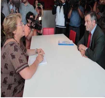
Horvath consideró que el programa de Parisi tiene más coincidencias con el de Bachelet que con el de Matthei.

El senador de RN y ex jefe programático de Franco Parisi, Antonio Horvath, dio a conocer este jueves el resultado de un análisis que realizó a los programas de gobierno de la candidata presidencial de la Nueva Mayoría, Michelle Bachelet, y de la abanderada de la Alianza, Evelyn Matthei.