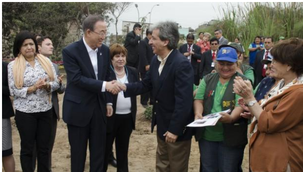
Ministro Manuel Pulgar - Vidal saluda a Secretario General de la ONU, Ban Ki - Moon, durante su visita al distrito de El Agustino.

en compañía del ministro del Ambiente, Manuel Pulgar – Vidal, y de la alcaldesa de Lima, Susana Villarán, visitó esta mañana el distrito limeño de El Agustino, para conocer un innovador proyecto que combate los efectos del cambio climático.